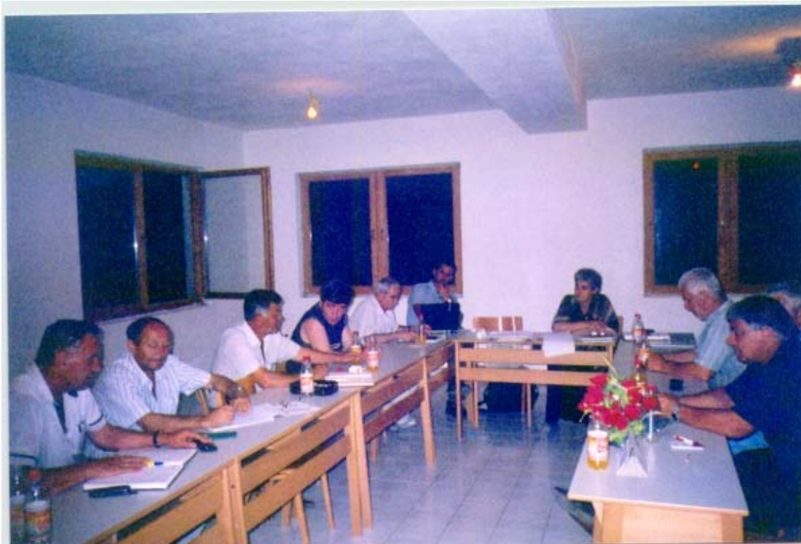
(Jedan od sastanaka ReeRGe)

Odluka o održavanju Sajma investicija je donesena na drugom sastanku ReeRGe sliva rijeke Bosna u oktobru 2003. godine