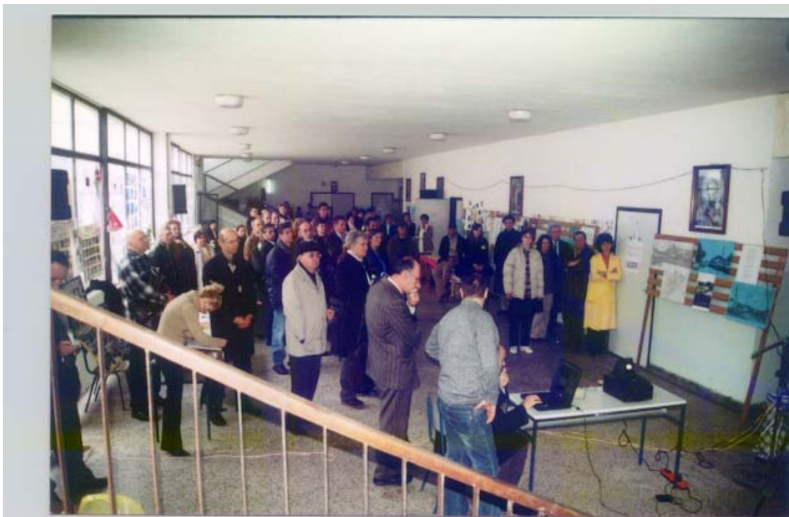
(Prezentacija projekata na Prvom sajmu)

Partneri u organizovanju Prvog sajma investicija su udruženje žena “Žene Doboja” i Centar Humanitas Dobj.